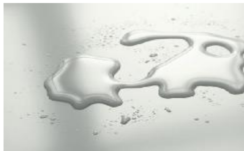
HG - lesk

Čistenie povrchu ilúzia: - doporučujeme čistiť švédskou handričkou namočenou do obyčajnej vody.