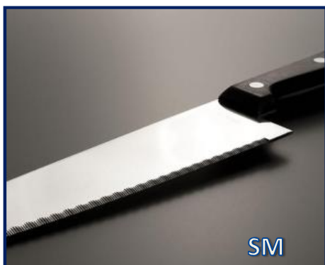
SM - polomat - iba na vertikálne použitie