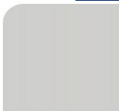
Alu Naturton M 9500 SM