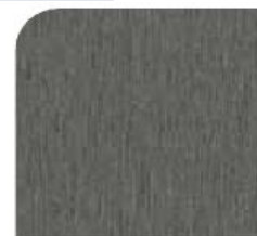
Alu Edelmetallton gebürstet M 9610 SM